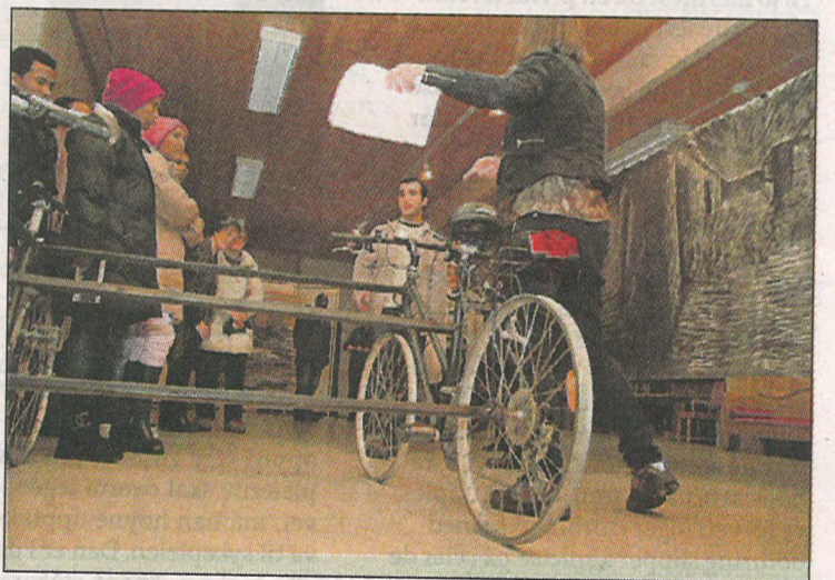
Sykler. Med to sammensveisede sykler kommer man ingen vei. Sykler og flyktinger er en sekvens i utstillingen.

Faktisk er det første gang han er på Fauske etter at familien hans flyttet sørover.