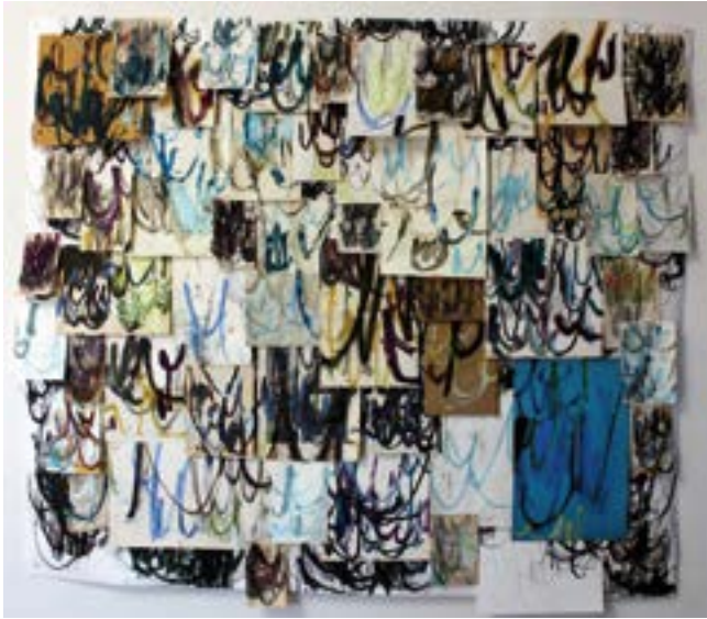
Hva Junifer vet olje, spray og penn på papircollage 150x177cm 2011

og dette avleirer seg også tydelig i materialet, både visuelt og taktilt. Hun har laget en rekke arbeider som spiller på kontrasten mellom overflate og underliggende sjikt av understrømninger som forvansker det åpenbare. En glitrende overflate legger seg over noe underliggende av en mer dyster karakter.