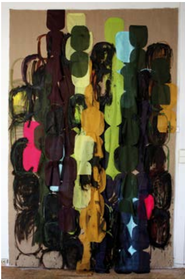
Barovessjan (Storskogen) tekstilmontasje, olje, spray på lerret 355x227cm 2010