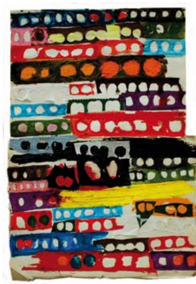
Selvportrett uten briller tekstil, olje og gouache på papir 69x53cm 2011