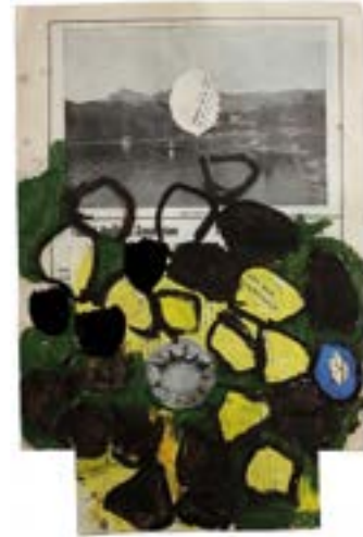
Uten tittel (Kvenneknurren) tekstil, olje, papir 2011