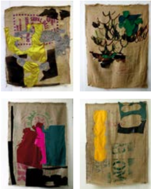
Fra utstillingen MALEREI. STICKEREI.

tekstilmontasje, olje, spray størrelser fra 110x88cm til 137x96cm 2010