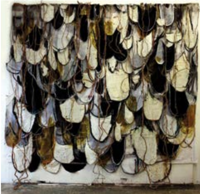
Jivakrus (Snøaker) olje, spray, kokostau, bjeller og tekstilmontasje 2011

kommunikasjon og meningssammenbrudd. Teksten blir et visuelt motiv som samtidig fordrer en kulturell koding. Noen arbeider er tradisjonelt vegghegte, eller henger ut fra vegg, andre fyller rommet med en raffinert og vedkommende kraft. Det er en fenomenologisk nerve her, betrakteren slipper simpelthen ikke unna en helhetlig sansning som overskrider en