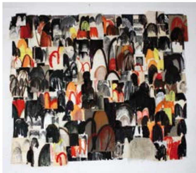
Hva Bruno vil olje, spray, tekstil og penn på papircollage 150x177cm 2011