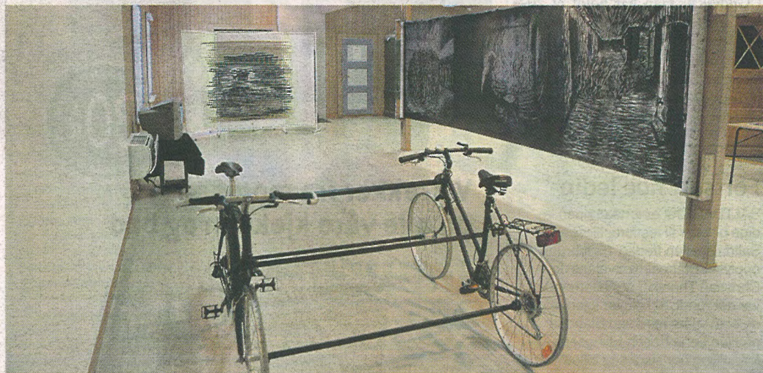
FORSKJELLIG. Det er forskjellig typer kunst Serhed stiller ut på Fauske.